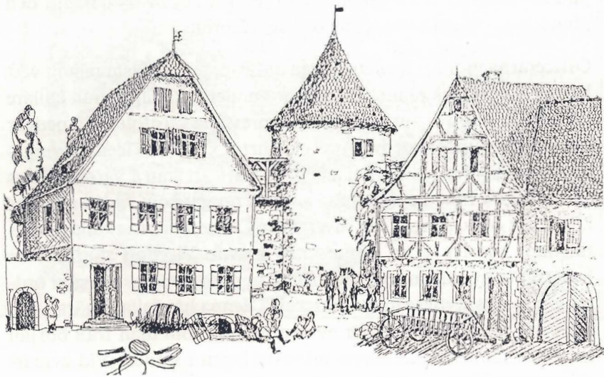
Svenska soldater utanför kyrkoherde Stapps hus vid kvarntornet. Teckning av Wolfgang Merklein, Karlstadt.